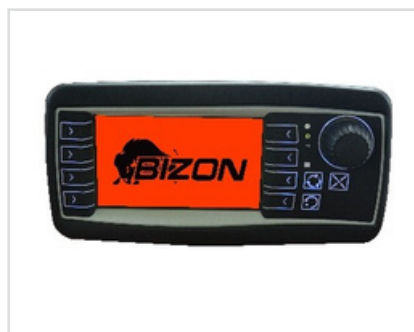
▶ Multifunkční ovládací panel pro ovládání všech funkcí