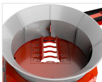
▶ Velkoobjemový zásobník materiálu