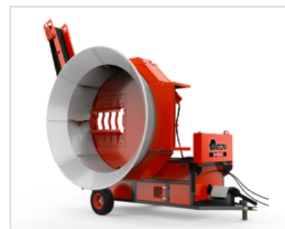
▶ Hydraulicky otevíraná/zavíraná drtící komory