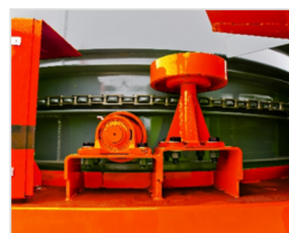
▶ Přítlačné válečky pro plynulé otáčení drtícího ústrojí