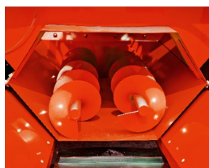
▶ Vysoce výkonné šnekové dopravníky