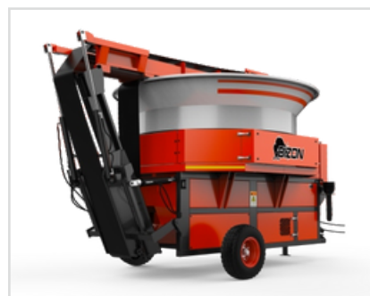
▶ Hydraulicky sklopný pásový dopravník