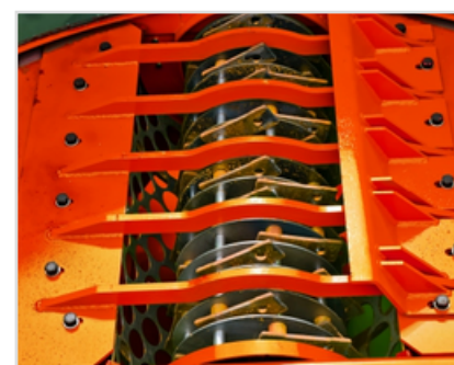
▶ Robustní drtící ústrojí s kladivy